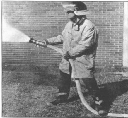
Figura 6.11. Método de Un-hombre en manguera de 1 1/2 pulgadas.

Para una utilización segura de una BIE de 45 mm \emptyset son preferibles dos personas, aunque una sola con la suficiente destreza puede manejarla.